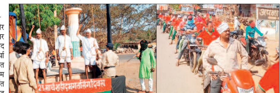
23 मार्च शहीद दिवस पर अमर शहीदों को दी गई श्रद्धांजलि, झांकियों ने जगाई देशभक्ति

कार्यक्रम की शुरुआत जन मुक्ति मोर्चा के कार्यकर्ताओं द्वारा शहीदों के चित्र पर माल्यार्पण एवं पुष्पांजलि अर्पित कर की गई। इसके साथ ही जन मुक्ति मोर्चा के दिवंगत नेताओं को भी श्रद्धांजलि दी गई। आयोजन स्थल पर उपस्थित लोगों ने दो मिन्ट का मौन रखकर शहीदों के बलिदान को नमन किया