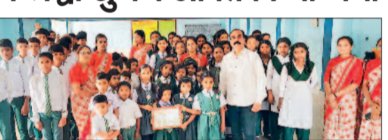
विवेकानंद हाई स्कूल में शहीदों को श्रद्धा सुमन अर्पित किया गया

डोंडी। डोंडी में शहीद दिवस मनाया गया। जिसमें शहीद सुखदेव थापर, भगत सिंह और शिवराम राजगुरु की शहादत को 23 मार्च को प्रति वर्ष शहीद दिवस के रूप में मनाया जाता है। 23 मार्च 1931 को लाहौर सेंट्रल जेल में ब्रिटिश हुकूमत ने फांसी दी थी। जिन्होंने भारतीय स्वतंत्रता संग्राम में अपने प्राणों की आहुति दी थे सभी युवा थे। लेकिन उनके विचार राष्ट्र भक्ति से ओत प्रोत थे यह दिन हमें याद दिलाता है कि आज जो स्वतंत्रता हमें मिली है। वह अनगिनत बलिदानों का परिणाम है, आज विद्यालय परिवार द्वारा सभी शहीदों की शहादत को याद करते हुए भावभीनी श्रद्धांजलि श्रद्धा सुमन अर्पित कर मनाया गया। छात्र छात्राओं को इसके महत्व को बता कर इसके मान सम्मान को बनाए रखने के लिए प्रेरित किया गया।