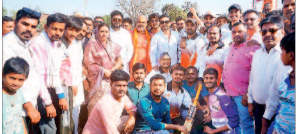
कुथरेल की सभापति ट्रॉफी क्रिकेट स्पर्धा, वार्ड 18 की टीम ने बाजी मारी