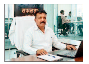
ब्लॉक कांग्रेस की नई कार्यकारिणी घोषित 31 कार्यकर्ताओं को मिली जिम्मेदारी

इस सुदृढ़ टीम में एक कोषाध्यक्ष के साथ 6 उपाध्यक्ष, 8 महामंत्री, 11 सचिव और 5 कार्यकारिणी सदस्य शामिल हैं। संगठनात्मक ढांचे को मजबूती देने के उद्देश्य से विभिन्न पदों पर अनुभवी और युवा कार्यकर्ताओं का समन्वय स्थापित