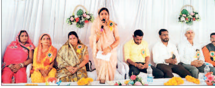
साहू समाज ने हर्षोल्लास से मनाई भक्त कर्मा माता जयंती